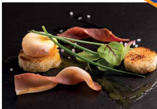
Nieuws uit je streek